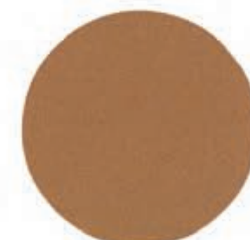
11 Koppar Metallic