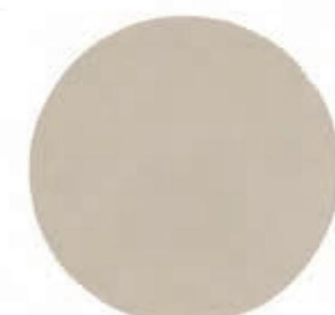
19 Pudert Pärlemor

Låt gärna Metall Dekorfärg skimra ikapp med någon av våra matta färger, t ex Pashmina. Trots att de är varandras motsatser är de som gjorda för varandra. Som du ser här kan du få Metall Dekorfärg i många olika kulörer.