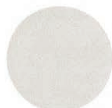
21 Ostron Pärlemor