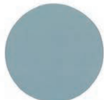
22 Ocean Metallic