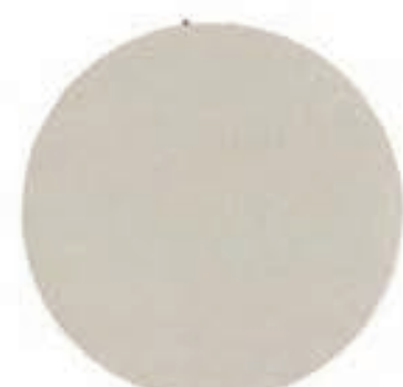
20 Bubbel Pärlemor