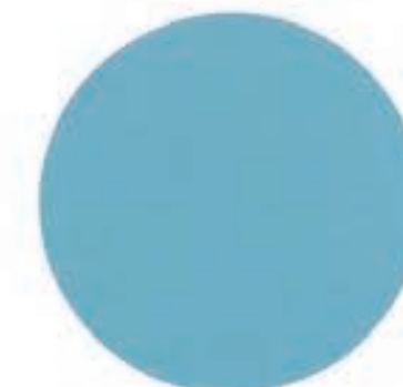
4 Riviera Metallic