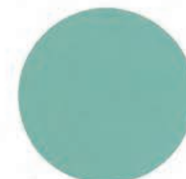
5 Lagun Metallic