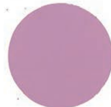
3 Vildros Metallic