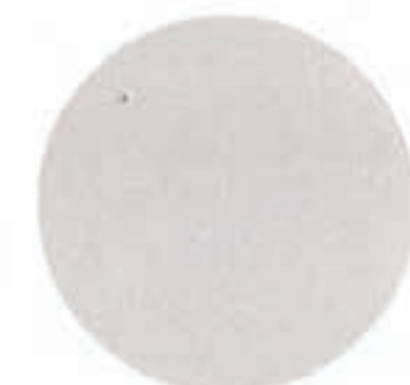
14 Silkesgrå Pärlemor