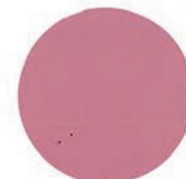
6 Rosso Metallic